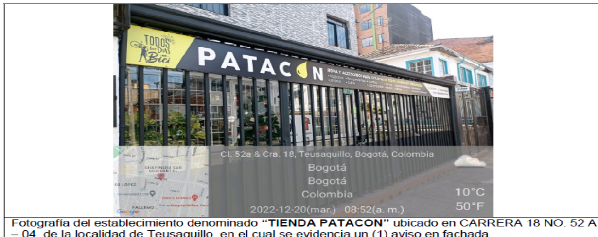
Fotografía del establecimiento denominado “TIENDA PATACON” ubicado en CARRERA 18 NO. 52 A – 04 de la localidad de Teusaquillo, en el cual se evidencia un (1) aviso en fachada.